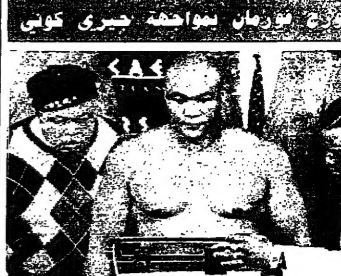
الملك جورج فورمان خلال عملية الوزن التي تسبق المباراة حيث يلعب مع الملك جيري كوشي على لقب بطولة العالم لوزن الخفيف

عقدت اللجنة العليا لاتحاد كرة القدم اجلستها الاسبوعية امس برئاسة رئيسها السيد الامون عساف وحضور الاعضاء. بعد تداول الاعضاء في الموضوع الرياضي الكروي العلم ولا سيما البدء بتأسيسها للموسم القادم.